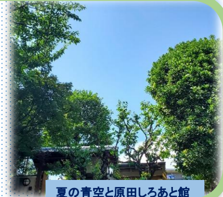
夏の青空と原田しろあと館