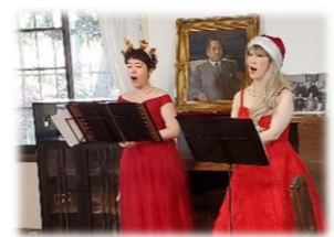
前回のライブ風景

ソプラノ！それだけでどこか敬遠されていませんか？一度このコンサートにお越しください。オペラ、クラシック、難しい、、、そんなイメージは見事に払拭されます。しっかりとした歌唱力と共に、エンターナーとしても優れた面々が繰り出すステージは見ても聞いても楽しいひと時です。